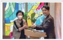
▶ 성경통독 학자