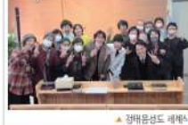
▶ 장마문서도 배제시