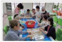
▶ 도라지 손질