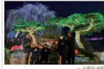
▶ 수목원 방문