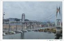
▶ 수목원 기생길