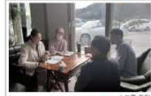
▶ 소그룹 모임