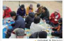
▶ 야외에서 후 점심식사