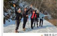
▶ 새벽 후 등산