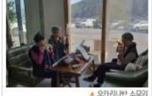
▶ 오가리(원 스토밍)