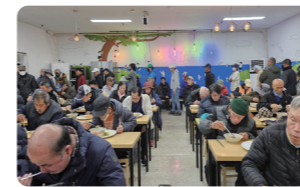
▲ 식사사진 전경