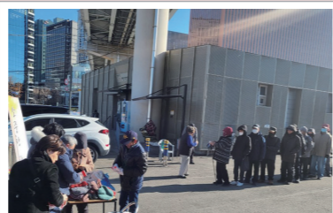
▲ 무학교회 후원 털모자 나눔