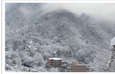
▲청평힐링센터 눈 온날