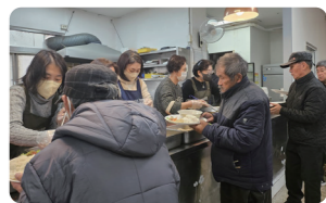
▲ 이씨회42기, 서빙고온누리교회, 학부모성경통독팀