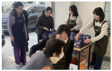
▲ cbs 합창단 간식나눔