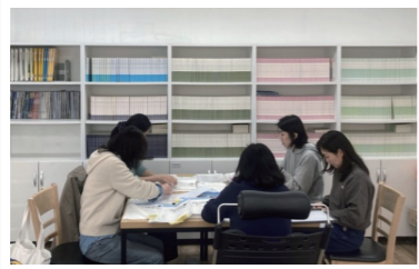
▲ 소식지 라벨 부착 봉사