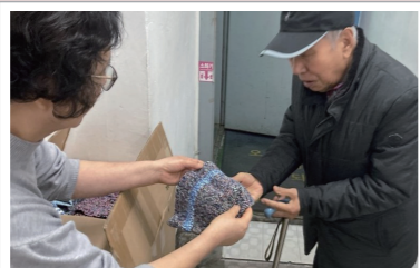
▲ 무학교회 후원 털모자 나눔